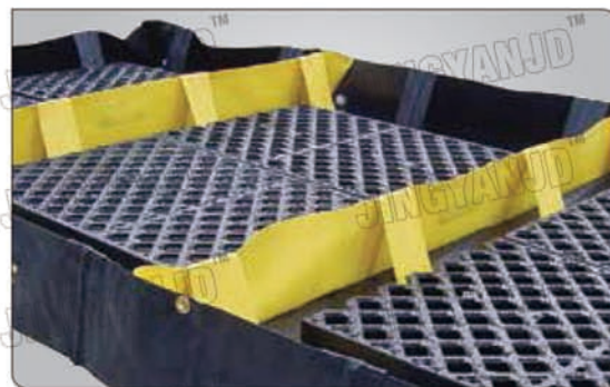
相互独立的盛漏槽可防止泄露液体混合。