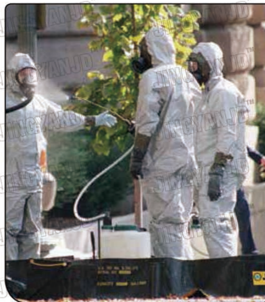
第一时间响应紧急溢漏救援部署，配合救援人员的应急清洗。